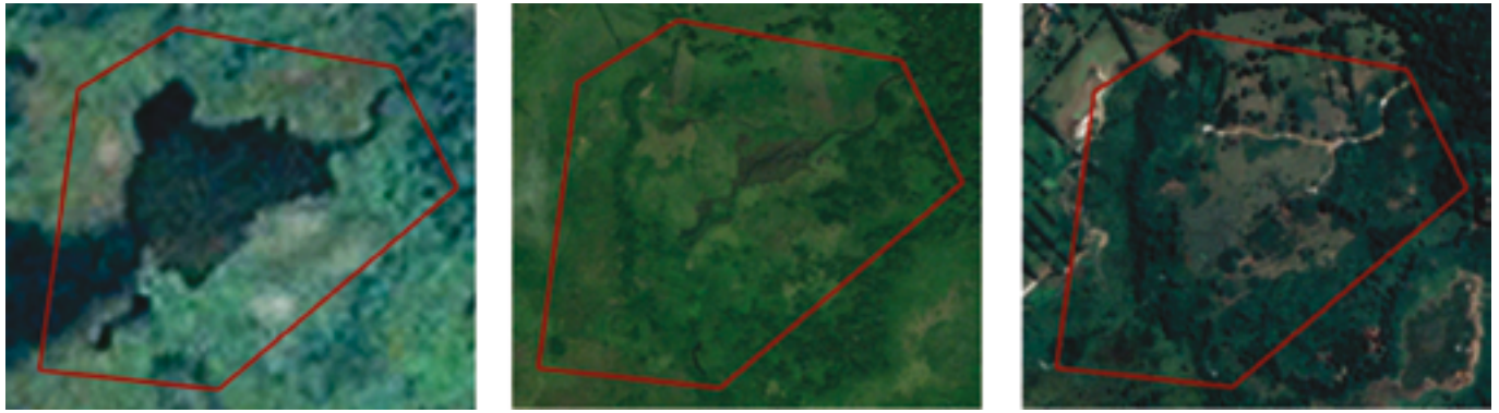
Figura 2: Situación del RVSLC en 1969, 2010 y 2018 con relación a polígono de refugio definido por SINAC-MINAE

Si bien la organización comunitaria ha conseguido detener (parte de) las acciones que dañaron el estadio bio-físico de la Laguna Las Camelias, los efectos ambientales acumulados de estas acciones son visibles en el refugio. La secuencia de imágenes satelitales mostrada en la figura 2 ilustra la trayectoria de reducción en el tamaño del espejo de agua de la Laguna Las Camelias desde su situación inicial (tomando como referencia la imagen satelital de 1969), hasta la desaparición del cuerpo de agua ilustrada en las fotografías de 2010 y 2018.